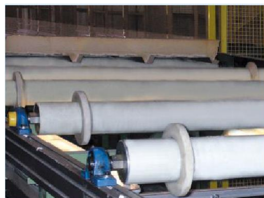
La superficie antitraccia protegge i prodotti