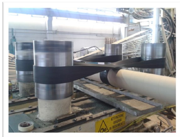
Cinghie da manicotto per tubiere