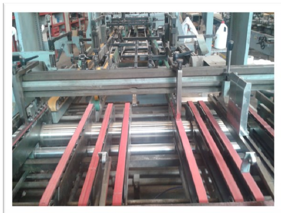
Cinghie introduzione mettifoglio per piegaincolla