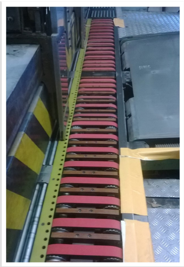
Cinghie dentate da manicotto per introduzione cartoni